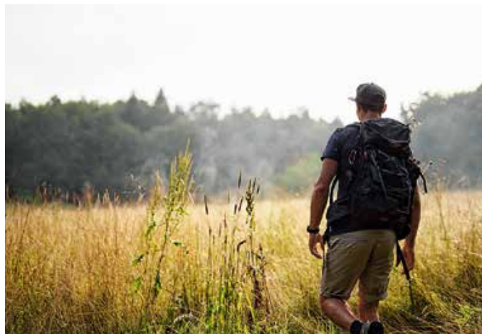
Jetzt kann man wieder Touren für den Unterallgäuer Wanderherbst melden.

Weitere Informationen gibt es unter Telefon (08261) 995-645.