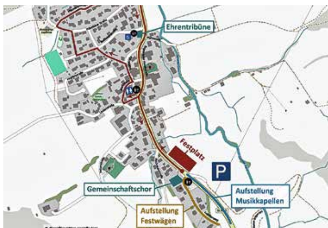
Lageplan Festumzug: Musikkapelle Engetried