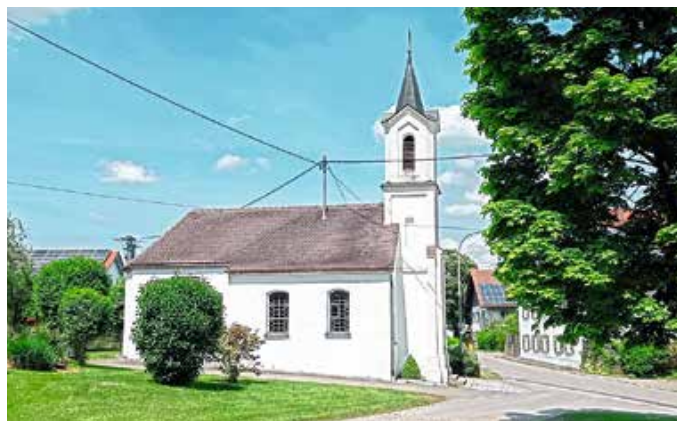
Bei der Kapelle „Unbefleckte Empfängnis Mariens“ in Lannenberg steht eine Renovierung an.

Beim Palmboschenverkauf erbatn wir uns Spenden für die Renovierung der Kapelle Lannenberg. Mit dem Geld können wir den Helfern und Helferinnen zwischendurch Getränke, eine Brotzeit und ein abschließendes Helferfest spendieren. Ein herzliches Vergelt's Gott für alle Mithilfe und die Spendenbereitschaft.