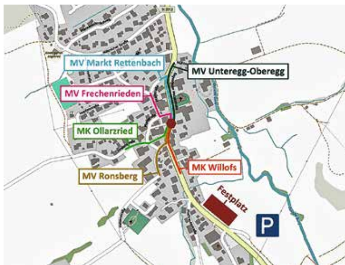
Lageplan Sternmarsch: Musikkapelle Engetried

Der Samstag verbindet musikalische Exzellenz mit absoluter Ausnahmequalität: Josef Menzl tritt in einer XXL-Besetzung auf, wie man sie sonst nur z.B. vom Oktoberfest in München kennt. Diese Formation steht für gewaltigen Klang, Party und Gänsehautmomente – Blasmusik in einer Dimension, die man selten erlebt. Im Anschluss sorgt Allgäu Power für pure Partystimmung. Mit einem Repertoire, das keine Wünsche offenlässt, wird der Festplatz zur Tanzfläche und der Samstagabend zum weiteren Höhepunkt des Wochenendes.