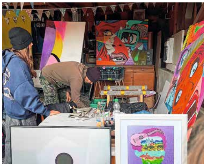
Kunsthandwerk, Bilder, Musik und Stoffe bedrucken, hieß es bei den kulTOUR-tagen im vergangenen Jahr in dieser offenen Werkstatt in Kammlach.

Veranstaltungen für die kulTOUR-tage können online bis 8. Juni gemeldet werden unter www.unterallgaeu.de/kultourtage