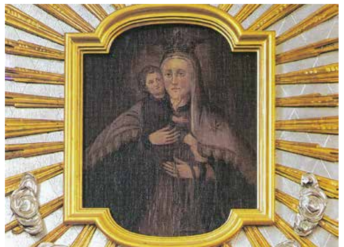
Bild der Muttergottes vom Berge Karmel